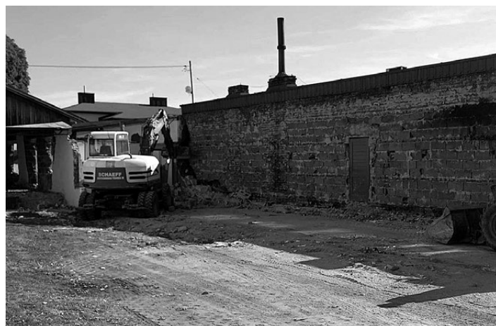
Wakacyjne porządki: na podwórku przy Przedszkolu w Galkowie Dużym wyburzono starą kwaciarnię.