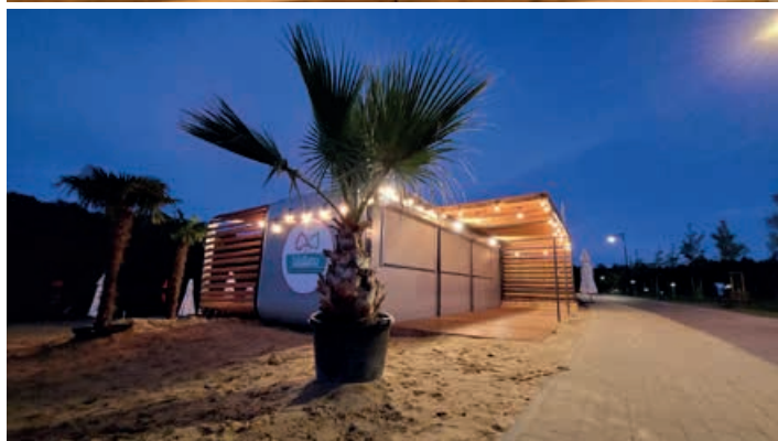
Takie rzeczy tylko w Lisowicach