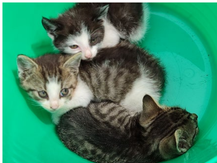
Małe kotki czekają na nowych właścicieli. Kontakt telefoniczny pod numerem 664-442-728