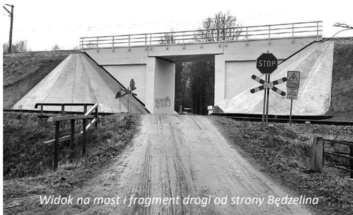
Widok na most i fragment drogi od strony Będzelina

Białym tłuczniem zostanie utwardzony kolejny odcinek tzw. czarnej drogi”, która prowadzi przez las z Koluszek do Będzelina. Przypomnijmy, że do tej pory tłuczniem wyłożony został fragment drogi od os. Zieleń do mostu kolejowego. Miało to miejsce w lipcu