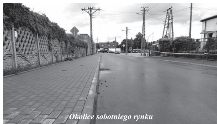
Okolice sobotniego rynku

Przypomnijmy, że pierwsze prace budowlane ruszyły pod koniec 2020 r. Z widoku zniknęły betonowe płyty. Drogi zyskały nową nawierzchnię, a tam gdzie to możliwe obustronne chodniki. Dodatkowo ulica Mickiewicza uzbrojona została w kanalizację deszczową. Pojawiły się na niej również wyniesione przejścia dla pieszych.