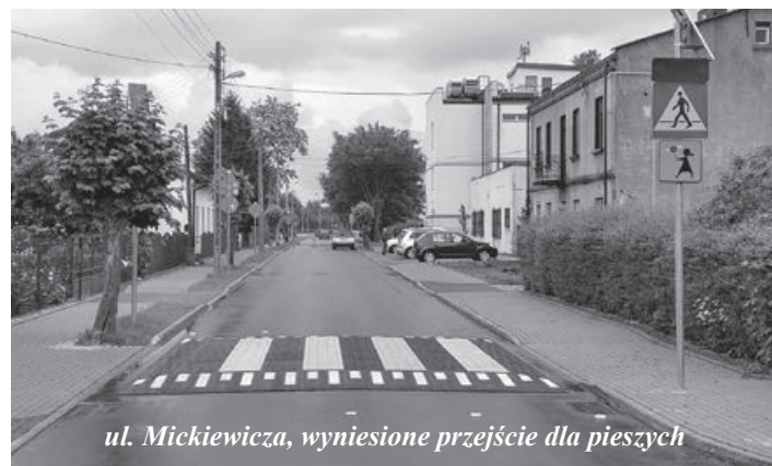
ul. Mickiewicza, wyniesione przejście dla pieszych

Gmina zakończyła duży projekt drogowy, związany z przebudową czterech ulic (Mickiewicza, Pomorską, Śląską i Hallera) zlokalizowanych wokół sobotniego rynku w Koluszkach. Inwestycja została już odebrana.