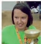
Zbiórka przez SOSW na operację OLIIWI

Główny organizator: STOWARZYSZENIE OKIEM KOBIETY