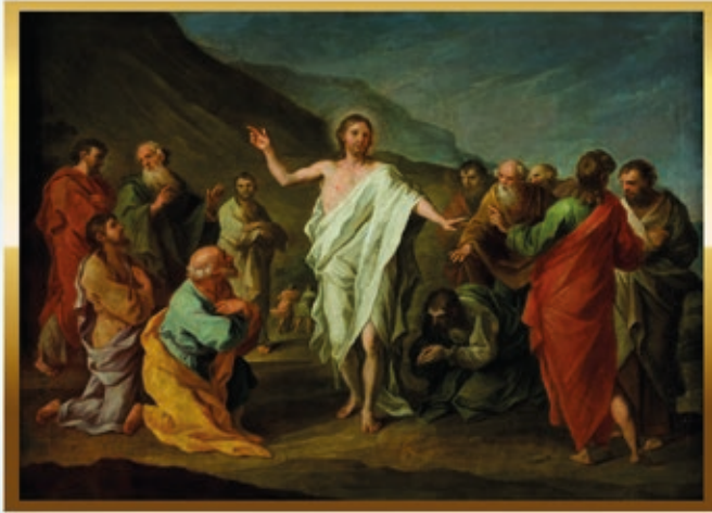
Chrystus ukazujący się apostołom po zmartwychwstaniu Szymon Chechowicz (1689-1775) Muzeum Narodowe w Krakowie (MKNK II-a-13)

Tegoroczne Święta Wielkiej Nocy będziemy przeżywali w wyjątkowym czasie. Do zmagañ świata ze skutkami pandemii dołączyła tragedia wojny za naszą wschodnią granicą w wyniku barbarzyńskiej napaści na Ukrainę. Zmartwychwstały Chrystus jest dla nas świadectwem, że zło można pokonać, a w ostatecznym rozrachunku zwycięża dobro. Niech i dziś Zwycięzca Śmierci przyniesie nam miłość i dobro, a w nasze serca wleje tak nam potrzebną otuchę i wiarę.