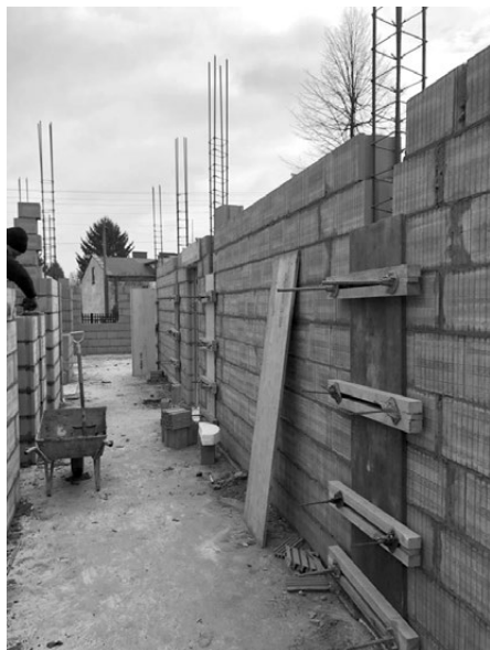
Tak rosną mury nowego skrzydła dla SP nr 2 i I LO w Koluszkach