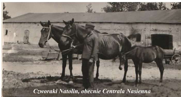
Czworaki Natolin, obecnie Centrala Nasienna