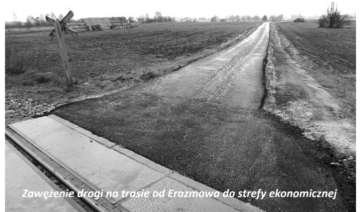
Zawężenie drogi na trasie od Erazmowa do strefy ekonomicznej

Na ul. Naftowej wciąż możemy jeszcze natknąć się na utrudnienia w ruchu, ale droga jest już całkowicie przejezdna. Na całej długości trasy od Erazmowa do naftobaz położono już asfalt. Jeśli chodzi o drogę od Erazmowa do strefy ekonomicznej, w poniedziałek wylewano jeszcze asfalt. Obecnie trasa jest już przejezdna. Niestety na skutek problemów z wykupem części pasa drogowego przez pola, na odcinku o długości ok. 100 metrów pas drogi został zwężony z 5,5 metra na 3 metry. Kierowcy muszą się liczyć ze znacznymi utrudnieniami podczas wymijania.