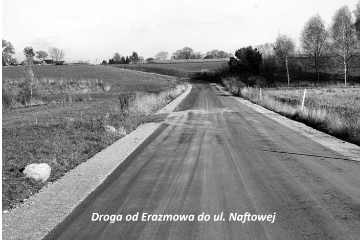
Droga od Erazmowa do ul. Naftowej

Przypominamy, że 8 listopada zamknięto wiadukt w Koluszkach. Z ronda Jana Pawła II nie zjedziemy zatem na drogową przeprawę nad torami, by przejechać na drugą stronę miasta. Najbliższy objazd znajduje się w Felicjanowie. Pierwszy przejazd kolejowy prowadzi nas przez Felicjanów i ulicę Krańcową do ul. Brzezińskiej w Koluszkach. Drugi przejazd w Felicjanowie kieruje nas do Erazmowa. W Erazmowie do wyboru mamy dwie trasy: przez pola do strefy ekonomicznej i ul. Nasiennej, lub przez pola i las do ul. Naftowej z wyjazdem na drogę wojewódzką.