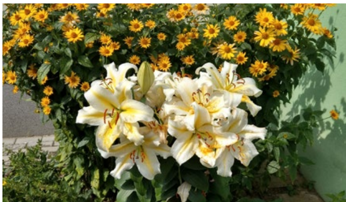
Efektowne lilie przed blokiem przy ul. Sikorskiego w Koluszkach

Chcesz pochwalić się swoim przydomowym ogródkiem kwiatowym, wyrosło Ci w ogrodzie coś nietypowego, zachwylił Cię widok pięknej przydomowej rośliny – wyślij nam zdjęcie z komentarzem i lokalizacją. Najciekawsze z nich przedrukujemy.