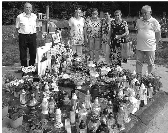
Grupa mieszkańców z Koluszek odwiedziła grób śp. Krzysztofa Krawczyka, który zmarł 5 kwietnia 2021 r. w wieku 74 lat

Osoby zainteresowane prosimy o przesłanie CV na adres email: biuro@cmplast.pl lub kontakt telefoniczny: tel. 505 210 010