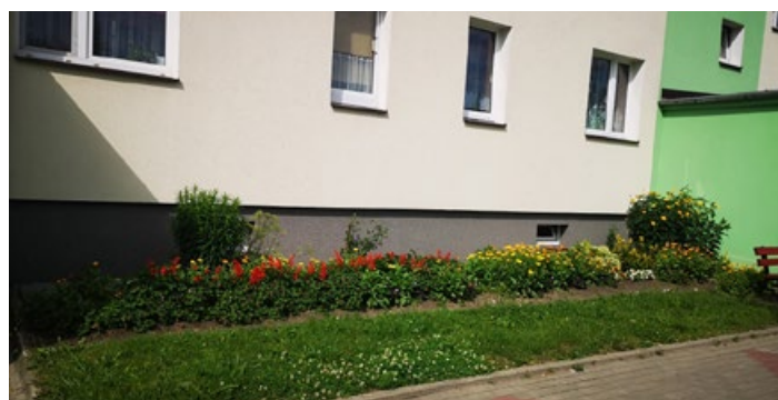
Wielu mieszkańców podziwia kwietny ogródek przy jednym z bloków przy ul. Sikorskiego w Koluszkach