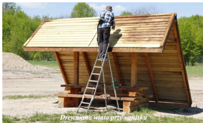
Drewniana wiatra przy ognisku

Jeżeli tylko wytyczne pandemiczne na to pozwolą, na terenie Lisowic czekają na nas liczne atrakcje. Pierwszą z nich będzie duży koncert, na który gmina ma zabezpieczone środki finansowe. Do Urzędu Miejskiego w Koluszkach zgłasza się również ponoć wiele prywatnych podmiotów, które chcą robić biznes nad zalewem. Budki z lodami, dmuchańce, zloty food trucków, to może być stały element lisowickiego pejzażu. (pw)