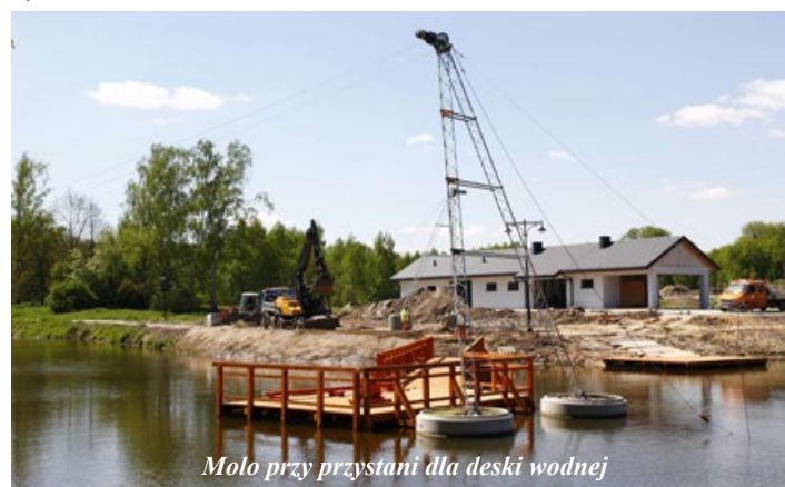
Molo przy przystani dla deski wodnej

Kompleks dysponuje budynkiem restauracyjnym, który niebawem zostanie wydzierżawiony osobom prywatnym. Będzie on funkcjonował przez cały rok, a nie tylko w sezonie wakacyjnym. Zapewne będzie on służył do organizacji przeróżnych imprez i uroczystości, na przykład rodzinnych. Będzie to oczywiście zależne od ofert dzierżawcy. Tuż przy restauracji ulokowano duży plac zabaw z licznymi zabawkami.