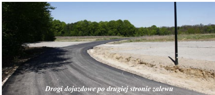
Drogi dojazdowe po drugiej stronie zalewu

Koszt budowy kompleksu wypoczynkowego w Lisowicach (wraz z zakupem odkrytych sezonowych basenów), wyniósł 11,5 mln zł. W ramach powyższej inwestycji gmina pozyskała dofinansowanie z UE w wysokości 7,5 mln zł.