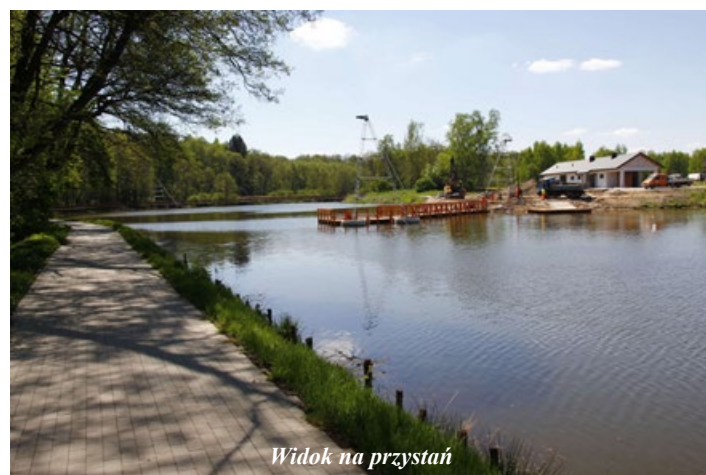
Widok na przystań

Do swego rodzaju atrakcji można z powodzeniem zaliczyć także bezpłatny internet, którego sygnał obejmie cały teren wypoczynkowy. Rutery zostały już rozlokowane.