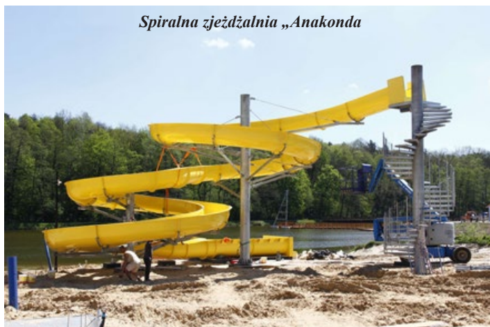
Spiralna zjeżdżalnia „Anakonda”

Na zalewie wzniesiono już szkielet mechanizmu, który napędzał będzie serfera na desce wodnej. Tuż obok budynku z zaple-