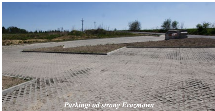
Parkingi od strony Erazmowa

Lisowice będą nas dalej zaskakiwać, ponieważ w drugiej części zalewu powstaje nie mniej ciekawy teren do rekreacji i wypoczynku. Przez całe wakacje po drugiej stronie mostku będą trwały prace przy utwardzaniu naturalnych ścieżek i porządkowaniu terenu. Przeniesione zostanie m.in. ogrodzenie Domu Opieki Społecznej, tak