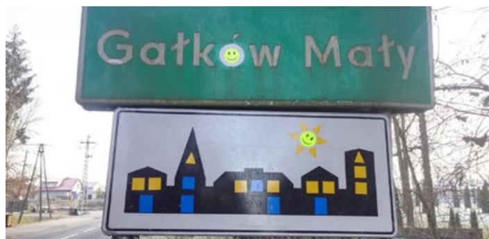
Uśmiechnięty Gałków Mały

Do konkursu przystępuje rodzina. Jej zadaniem jest ubranie choinki. W terminie do 22 grudnia pełnoletni przedstawiciel przesyła – wraz z podpisaną klauzulą zgody – na adres e-mailowy Biblioteki ( mbpkoluszki@wikom.pl ) dwa zdjęcia. Jedno dokumentujące pracę przy ubieraniu drzewka bożonarodzeniowego, a drugie prezentujące efekt końcowy. Na zdjęciu ubranej choinki nie zamieszczamy wizerunku. Jury przyzna trzy nagrody. Przewidziana jest również nagroda publiczności, którą zdobędzie fotografia z największą liczbą lajków na profilu facebookowym Biblioteki. Zdjęcia zamieszczone zostaną w dniu 23 grudnia. Głosowanie publiczności będzie trwało do 28 grudnia do godz. 16.