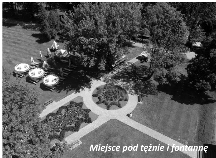
Miejsce pod tężnie i fontannę

W Parku Miejskim w Koluszkach mają stanąć tężnie solankowe. Opracowanie projektu nowej inwestycji zostało uwzględnione w projekcie budżetu gminy na rok 2021. Termin budowy nie został jednak jeszcze określony. Z pewnością nie będzie to przyszły rok. Tężnie miałyby pojawić w sąsiedztwie projektowanej parkowej fontanny, a więc tuż za miejscami siedzącymi amfiteatru.