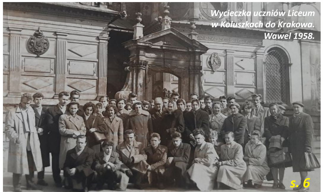
Wycieczka uczniów Liceum w Koluszkach do Krakowa. Wawel 1958.