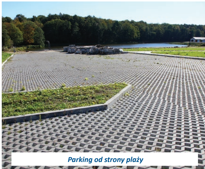
Parking od strony plaży