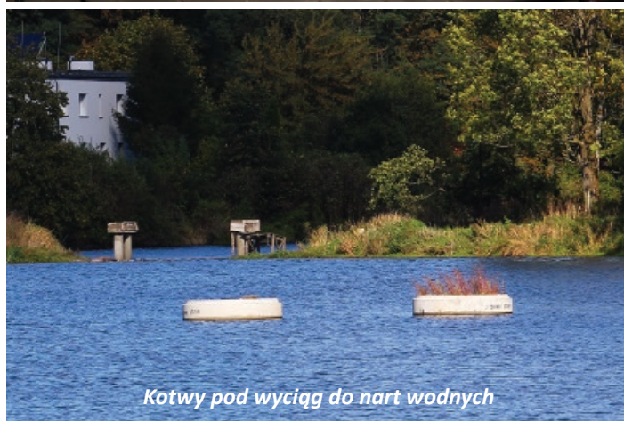
Kotwy pod wyciąg do nart wodnych