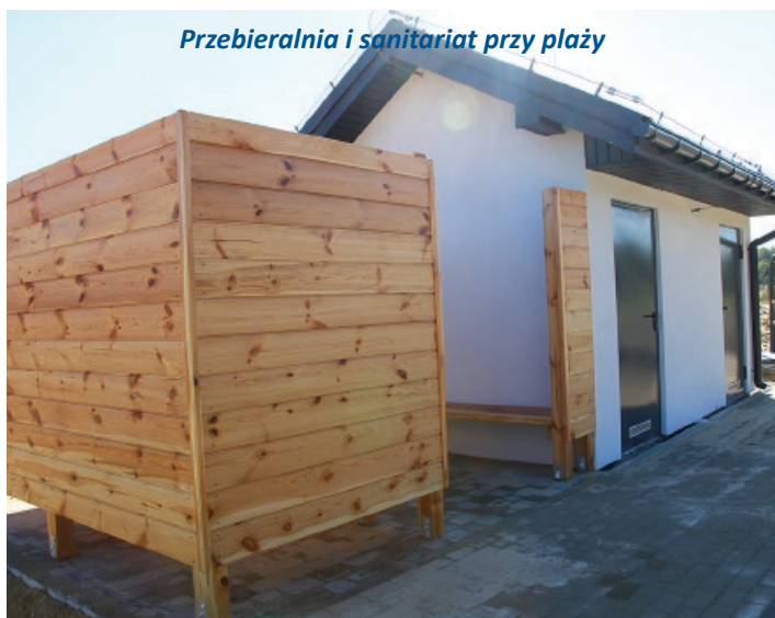
Przebieralnia i sanitariat przy plaży