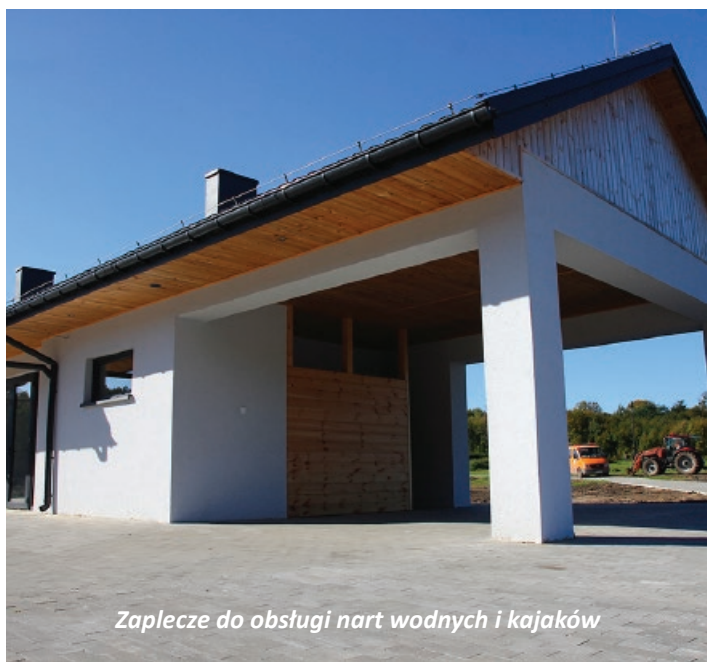
Zaplecze do obsługi nart wodnych i kajaków