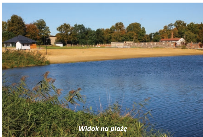
Widok na plażę