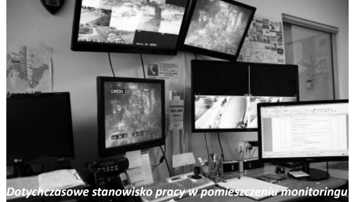
Dotychczasowe stanowisko pracy w pomieszczeniu monitoringu

W budynku Urzędu Miejskiego w Koluszkach ruszyła budowa Centrum Monitoringu, który zarządzać będzie siecią 65 nowoczesnych kamer rozlokowanych na terenie naszej gminy. Będą to zupełnie nowe urządzenia cyfrowe, tworzone na bazie nowoczesnych rozwiązań informatycznych. Kamery będą