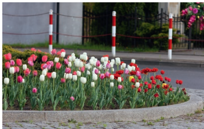
Tulipany przyozdobiły rondo

Przekonajcie się sami, że z nami jest fajnie! Jeżeli są Państwo zainteresowani taką formą współpracy prosimy o informację mailową na adres: rejestracja@promuza.org lub telefonicznie pod nr 693-448-944.