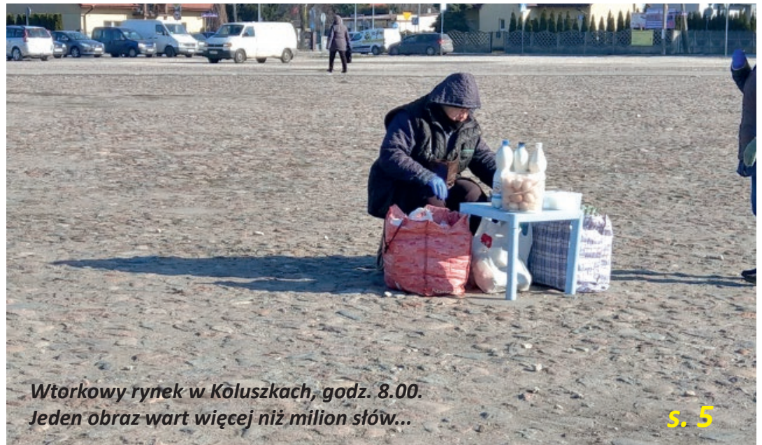
Wtorkowy rynek w Koluszkach, godz. 8.00. Jeden obraz wart więcej niż milion słów...