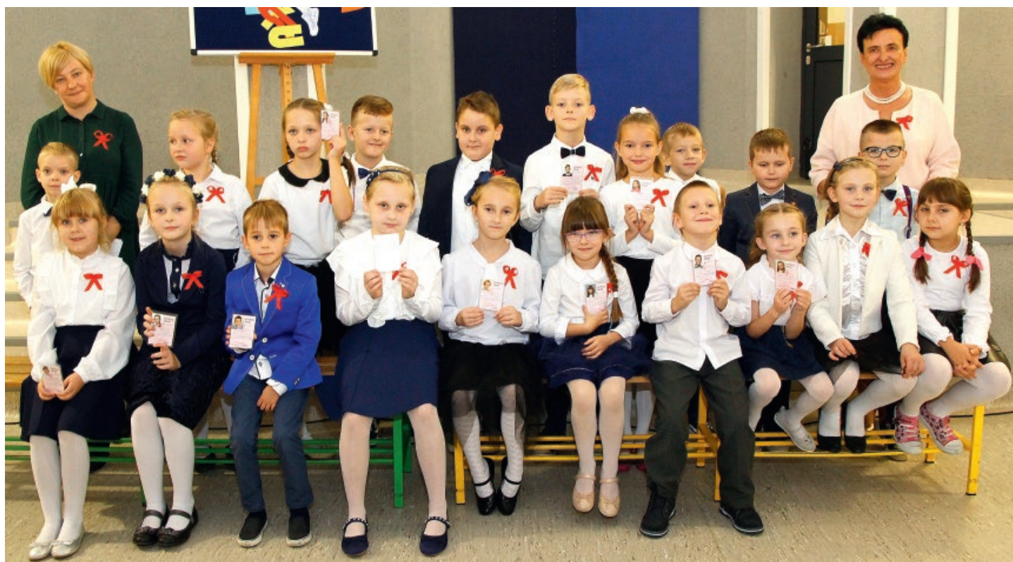
Szkoła Podstawowa nr 1 w Koluszkach. Klasa I b.