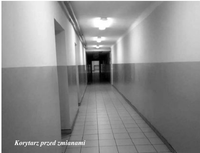
Korytarz przed zmianami