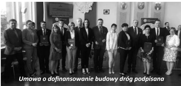
Umowa o dofinansowanie budowy dróg podpisana

Wciąż wstrzymane są prace drogowe na dwóch największych osiedlach domów jednorodzinnych w Koluszkach, czyli na os. Łódzkim i Łódzkim II. Zdaniem przedstawicieli Urzędu Miejskiego w Koluszkach prace stanęły ponieważ wykonawcy wykorzystali zakontraktowaną na dany rok pulę pieniędzy (sprzyjająca pogoda spowodowała że zaplanowane prace mogły zostać wykonane o wiele szybciej), a gmina nie dysponowała wolnymi środkami, które mogły zostać uruchomione na pozaplanowane przyspieszenie prac. Z informacji od wykonawcy wynika, że prace na osiedlu Łódzkim wznowione zostaną we wrześniu. (pw)