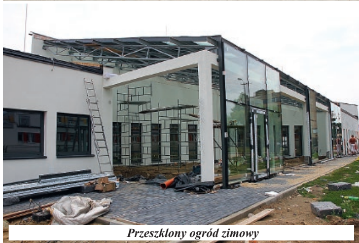
Przeszklony ogród zimowy