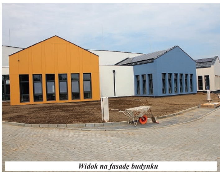
Widok na fasadę budynku