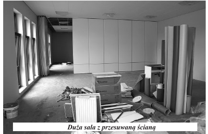
Duża sala z przesuwaną ścianą

Ku końcowi zmierza budowa nowego przedszkola przy ul. Budowlanych. Budynek jest już wzniesiony. Obecnie trwają prace wykończeniowe. Z większych zaplanowanych prac, do ukończenia pozostał jeszcze ogród zimowy, czyli przeszklone pomieszczenie na obrzeżach budynku, w którym bez konieczności wychodzenia na powietrze, przedszkolaki będą mogły przebywać w otoczeniu przeróżnych roślin. Latem drzwi ogrodu będą rozsuwane, a tym samym stanie się on integralną częścią zieleni wokół przedszkola. Obecnie trwa montaż olbrzymich szklanych paneli.