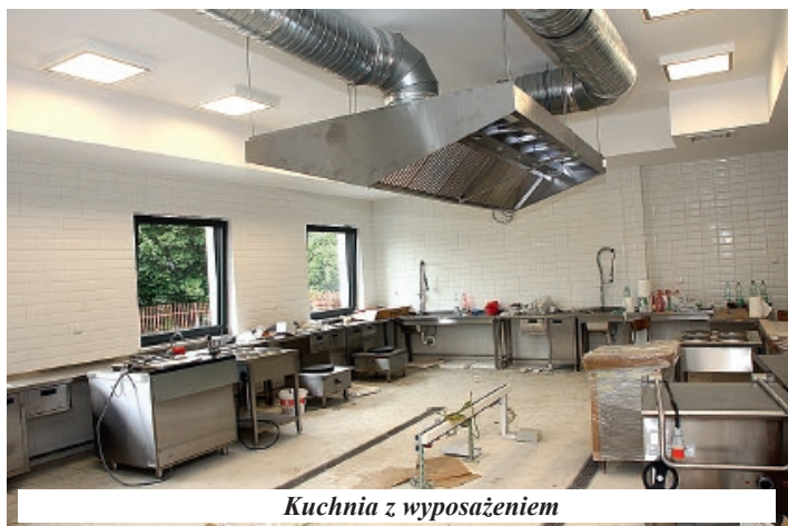
Kuchnia z wyposażeniem