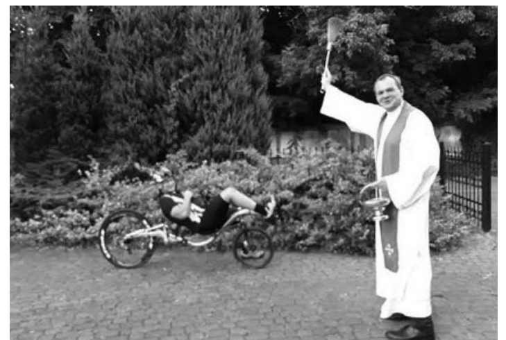
Wspomnienie św. Krzysztofa patrona kierowców – poświęcić wypada każdy pojazd