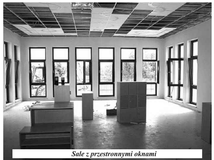
Sala z przestronnymi oknami

W stosunku do starego obiektu, nowe przedszkole zyskuje również na lokalizacji. Przy przedszkolu znajduje się mnóstwo miejsca do parkowania samochodów, co przy obecnym stylu życia należy bardzo docenić.