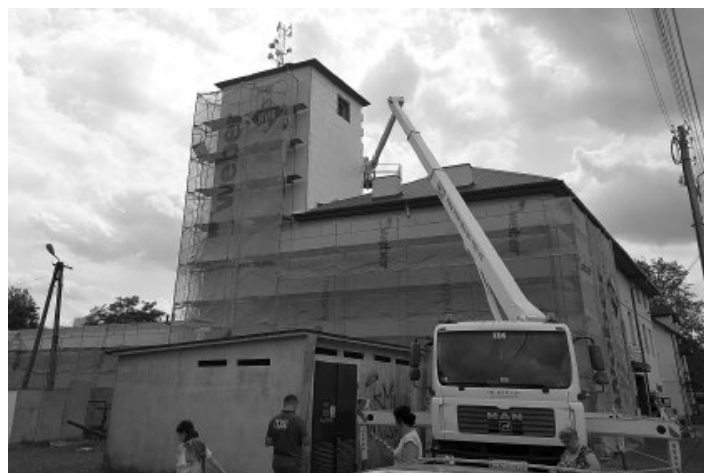
Do ocieplenia strażnicy OSP Koluszki trzeba było użyć specjalistycznego podnośnika

wały się kiedyś pod zwalami śmieci, które przez lata ktoś tu sobie urządzał. W tej chwili ziemia na tym miejscu została już wielokrotnie przerzucona, także nie ma mowy, by coś odnaleźć. Szkoda, bo w naszej ewidencji ten obszar był odnotowany jako miejsce występowania krzemienia z epoki kamienia, prawdopodobnie neolitu. Krzemień ten jest bardzo trudny do odnalezienia, tym bardziej żal, że nic z tego nie znaleźliśmy. Ale podkreślę, te ślady zostały w sposób zdecydowany zniszczone przez ludzką działalność. To, co można było znaleźć, zginęło pod zwalami tych śmieci, na które patrzmy, przemieszanych z piaskiem, przywiezionym tu nie wiadomo skąd - zaznaczyła Katarzyna Badowska inspektor d.s. zabytków archeologicznych. Zk