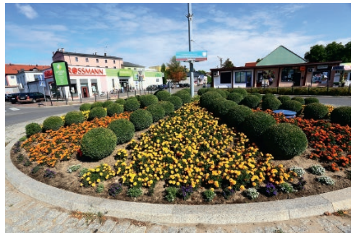
Kolorowe lato - Rondo Prymasa Wyszyńskiego w Koluszkach